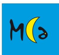
MUSEO a CIELO aperto di Camo